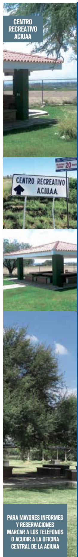
CENTRO RECREATIVO ACIUAA

Los maestros que integraron este curso fueron del Centro de Ciencias Básicas, Centro de Ciencias Económicas y Administrativas, Centro de Ciencias de la Salud, Centro de Educación Media y Centro de Ciencias Sociales. Los participantes se sintieron muy satisfechos por tomar este curso, porque, además de aprender a bailar, esta actividad es muy relajante. Esperamos que el siguiente semestre haya compañeros interesados en sumarse a este curso.