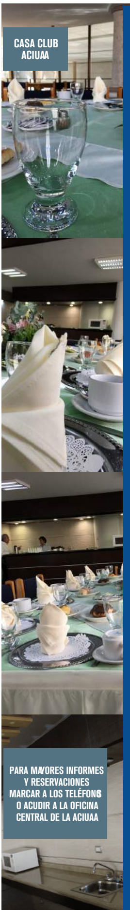
CASA CLUB ACIUAA

PARA MAYORES INFORMES Y RESERVACIONES MARCAR A LOS TELÉFONOS O ACUDIR A LA OFICINA CENTRAL DE LA ACIUAA