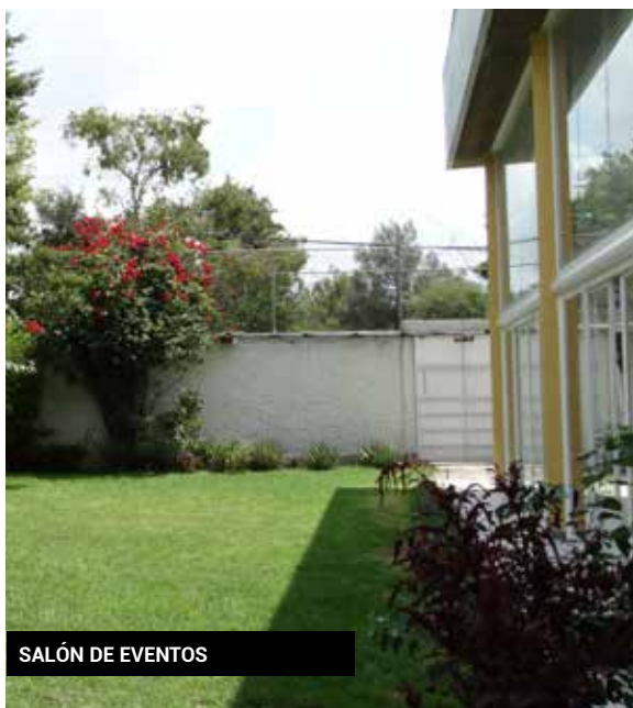
SALÓN DE EVENTOS