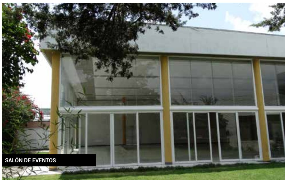
SALÓN DE EVENTOS

Salón, ubicado en Av. Revolución (frente al parque de la Pona), es el espacio indicado para la celebración de eventos sociales importantes, como bodas, bautizos, posadas o quince años. Contamos además con vigilancia constante, durante la celebración de los eventos, con el fin de garantizar la seguridad de los invitados.