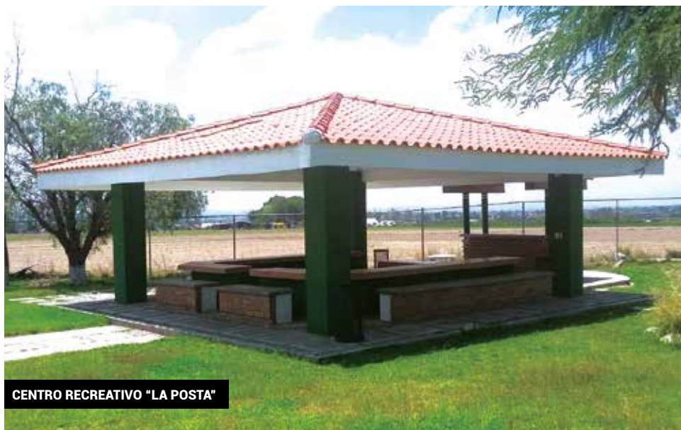
CENTRO RECREATIVO "LA POSTA"

Salón de eventos. Con el objetivo de apoyar a nuestros agremiados en la realización de sus eventos sociales, la ACIUAA pone a disposición de los maestros un Salón de Eventos con una capacidad máxima para 350 personas. Es un amplio espacio acondicionado con mesas y sillas, jardines, cocina, además de baños amplios y limpios. Nuestro