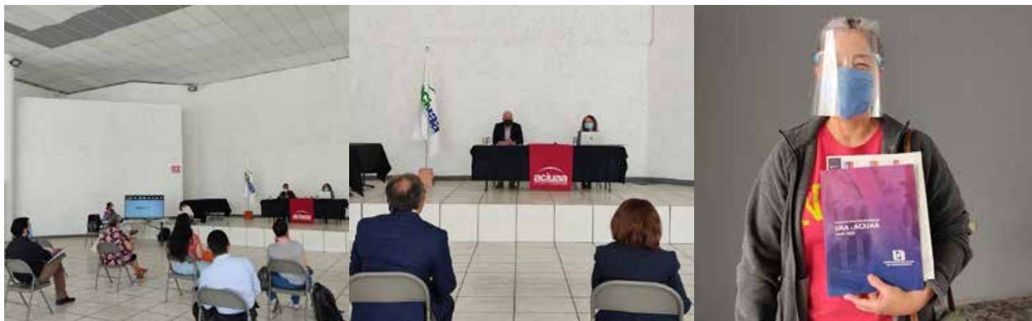
Asamblea General Ordinaria fraccionada y permanente, del 8 al 12 de marzo 2021. Salón ACIUAA.